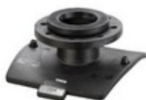
Types M et GV