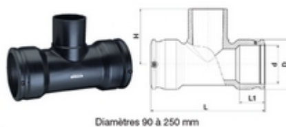
Diamètres 90 à 250 mm