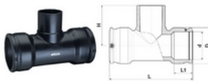
Diamètres 90 à 250 mm