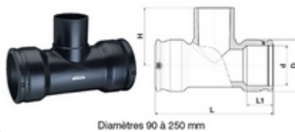
Diamètres 90 à 250 mm