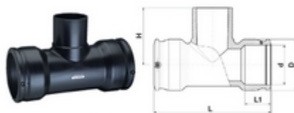
Diamètres 90 à 250 mm