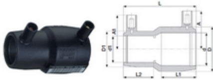
Diamètres 25 x 20 à 110 x 90 mm