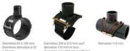
Diamètres 63 à 120 mm Diamètres d'isolation ø 32 à 62 mm