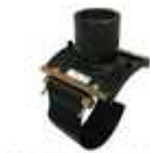
Diamètres 200 à 215 mm sauf déviation 110 mm et tout diamètres avec déviation ø 80 mm