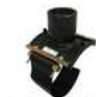
Diamètres 200 à 215 mm sauf déviation 110 mm et tout diamètres avec déviation \varnothing 80 mm